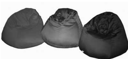
De muurschildering en zitzakken in de nieuw ingerichte snoezelruimte.